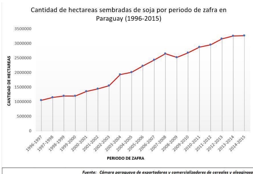
Cuadro 1. Área de siembra, producción y rendimiento de soja en Paraguay (1996-2015)